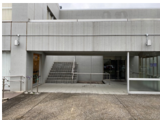
↑ 階段を上がる Up stairs