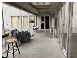
↑ 右手奥の扉が会場 The door at the back on the right side is the venue