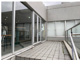
↑ 階段を上った先の扉から入る The door at the top of the stairs.