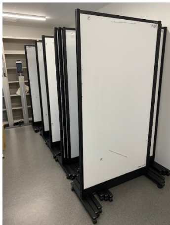
マグネット利用可 Magnet available

15 poster boards (double-sided, up to A0, W876 x H1643) are available on stands for poster sessions.