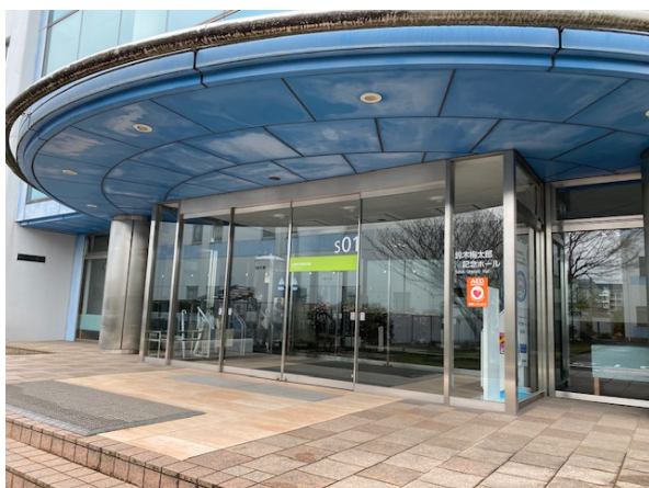
Entrance of Suzuki Umetaro Hall

It is about a 6-minute walk from the West Gate Guard Station to The Suzuki Umetaro Hall(Building No. S01).