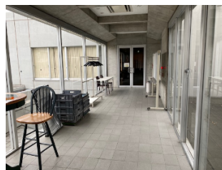
↑ 左手奥の扉が会場 The door at the back on the left side is the venue.