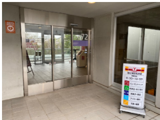
↑ 入口 Entrance